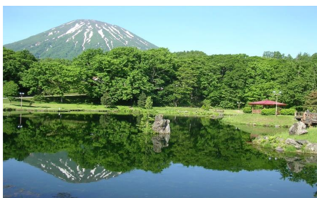
【ふきだし公園と羊蹄山】