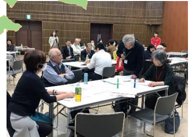
オホーツク管内市民後見人活動交流会