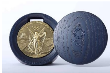
東京五輪メダルケース