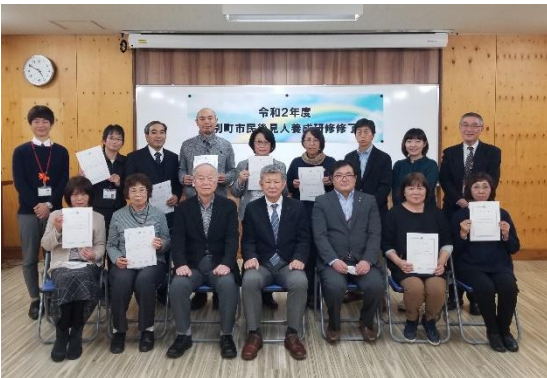
令和 2 年度 第 4 期津別町市民後見人養成研修了式