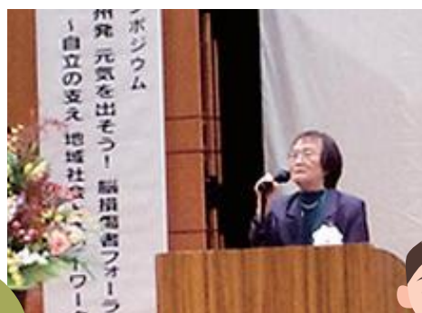
脳外傷 リハビリテーション 講習の開催

自動車事故被害者やそのご家族に対するリハビリテーションや心のケアに関する情報提供、交通遺児の支援、被害者の生活を支援するための研究事業などを実施しています。