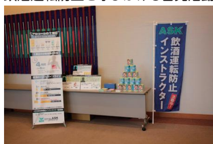
飲酒運転防止を呼びかける啓発活動

自動車事故被害者を生まないためには、事故そのものを防止することが必要です。自動車事故を防止するための研究事業や啓発活動などを実施しています。