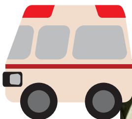
救急車や医療機器の寄贈

自動車事故でケガをした被害者が迅速・適切な治療を受けられるようにするための研究事業や機器寄贈などを実施しています。